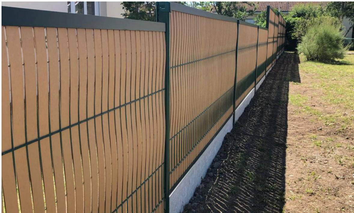
3 couleurs tendances au choix